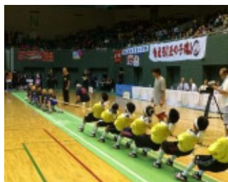
全日本ジュニア・ユース綱引選手権大会